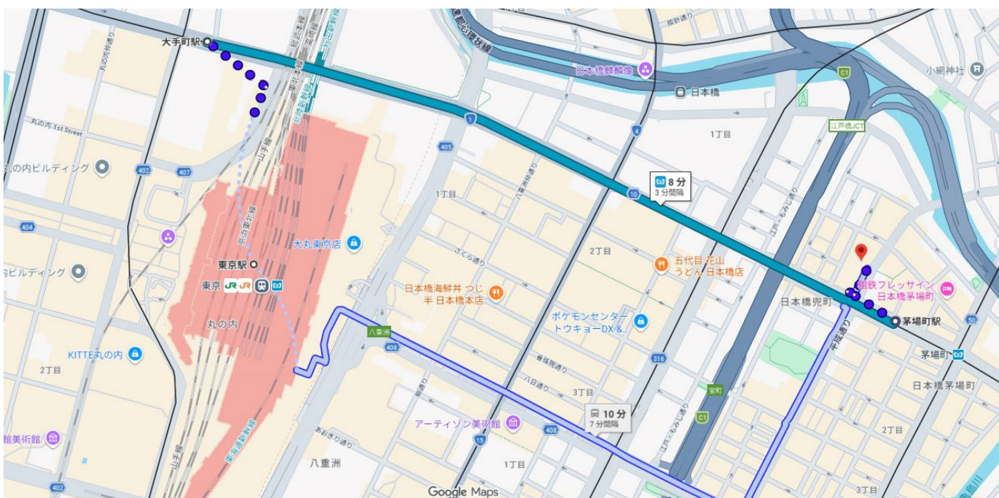
カビート日本生産者食堂：東京都中央区日本橋兜町7-1